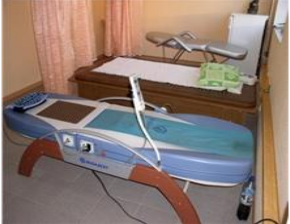
سلێمانی (PNA) - سه‌رجه‌م سه‌نته‌ره‌کانی ماساژ له‌شاری