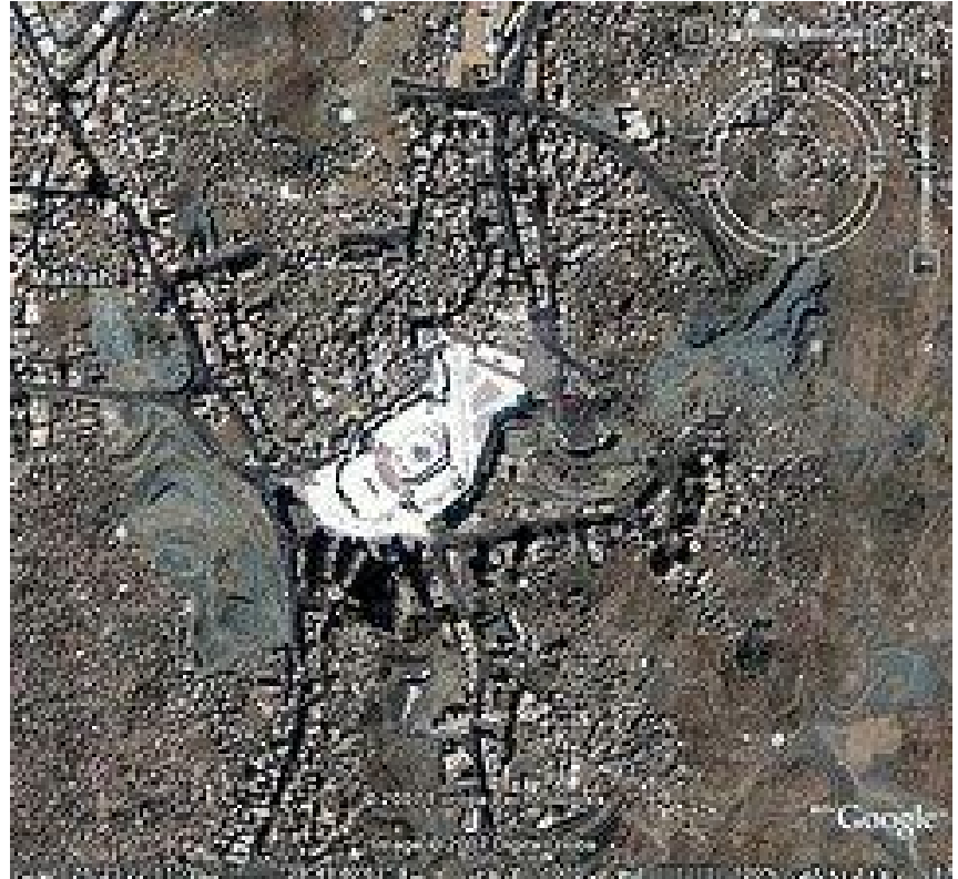
صورة لبيت الله الحرام عبر الأقمار الصناعية